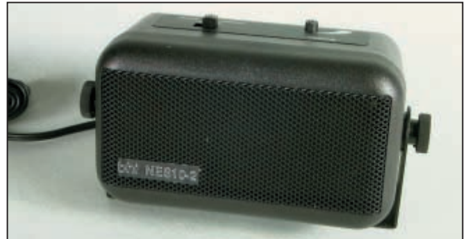
4 - Un petit haut-parleur supplémentaire presque banal.

Le NES10-2 peut, bien entendu, être utilisé en fixe comme en mobile et saura même s'avérer utile pour des professionnels. Sur mon véhicule, j'ai pu