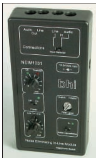
1 - Le NEIM 1031 est d'un format assez inhabituel pour ce type d'accessoire.

en convenir, l'éliminateur (on devrait dire "réducteur") de bruit ne souffre pas d'autre critique. Nous allons voir qu'il remplit bien sa mission.