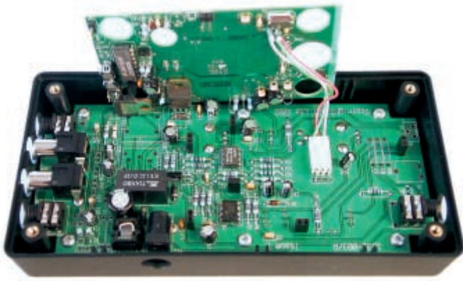
3 - En ôtant la première platine, on découvre le reste de l'électronique.

dans tous les sens le sélecteur de niveau en pensant qu'il n'agit pas, écoutez attentivement pendant quelques secondes ! Il est intéressant de noter l'efficacité de la réduction du bruit sur une émission non squelchée. Ainsi, l'écoute des bandes aviation apparaît moins fatigante si l'on ne peut fermer le squelch pour écouter une station faible: le bruit de fond est réduit alors que le signal de la station faible passe toujours.