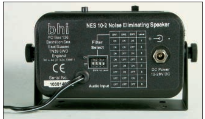
5 - Le réglage du niveau de réduction se fait à l'aide d'un DIP-switch.

noter la disparition du petit bruit lié à l'alternateur, présent lorsque j'écoute des stations AM (aviation). Il existe un modèle simplifié: le NES CB sur lequel le niveau de réduction du bruit est fixe. Ce der-